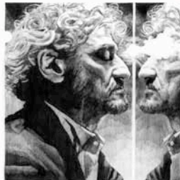
The Dead Brothers - Death is Forever